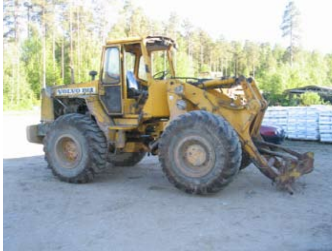
Kuva 1. Tapaturmassa mukana ollut pyöräkuormaaja.