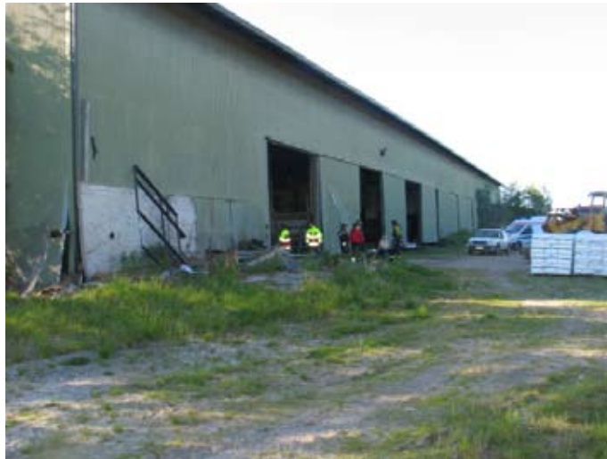
Kuva 2 Konehalli, jonka oven kohdalla tapaturma sattui.