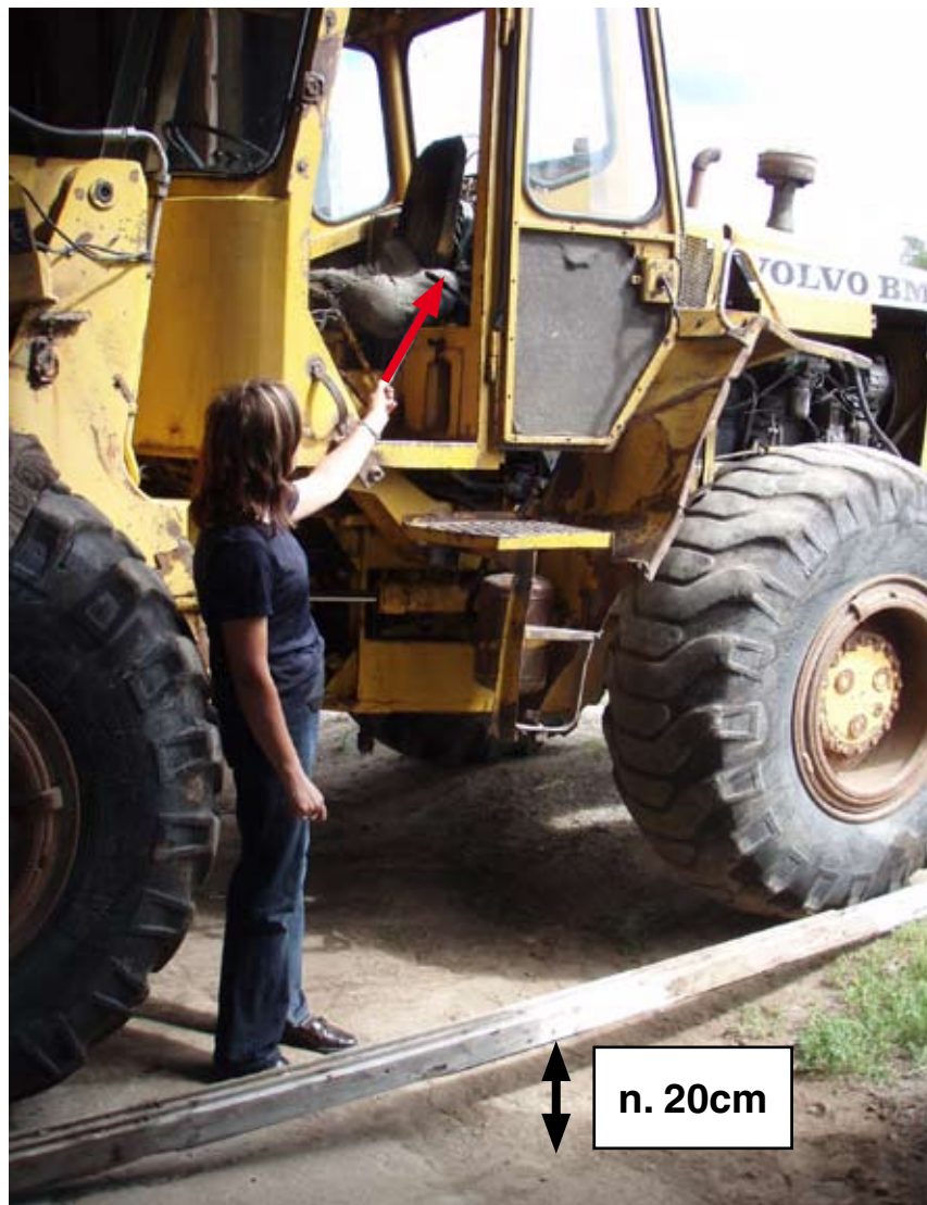
Kuva 5 Henkilö osoittaa käsijarrun kahvaa. Kuvassa näkyy hyvin sadeveden kuluttaman uran syvyys, mikä mahdollisti kuormaajan liikkeelle lähtemisen.