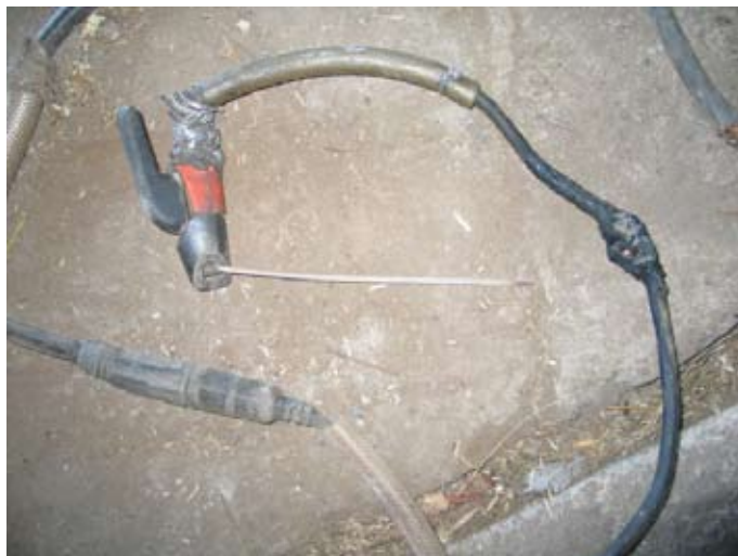
Kuva 3 NN:n käyttämät hitsausvälineet.