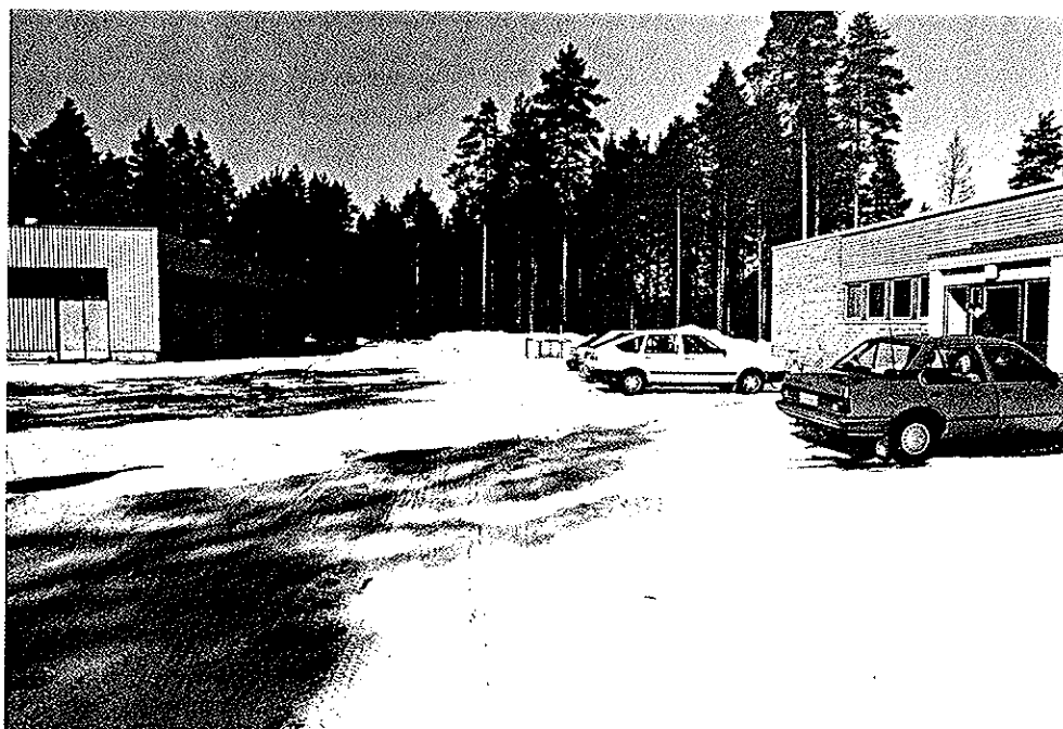
Kuva 3. Vasemmalla puhdistamo, oikealla valvomo.