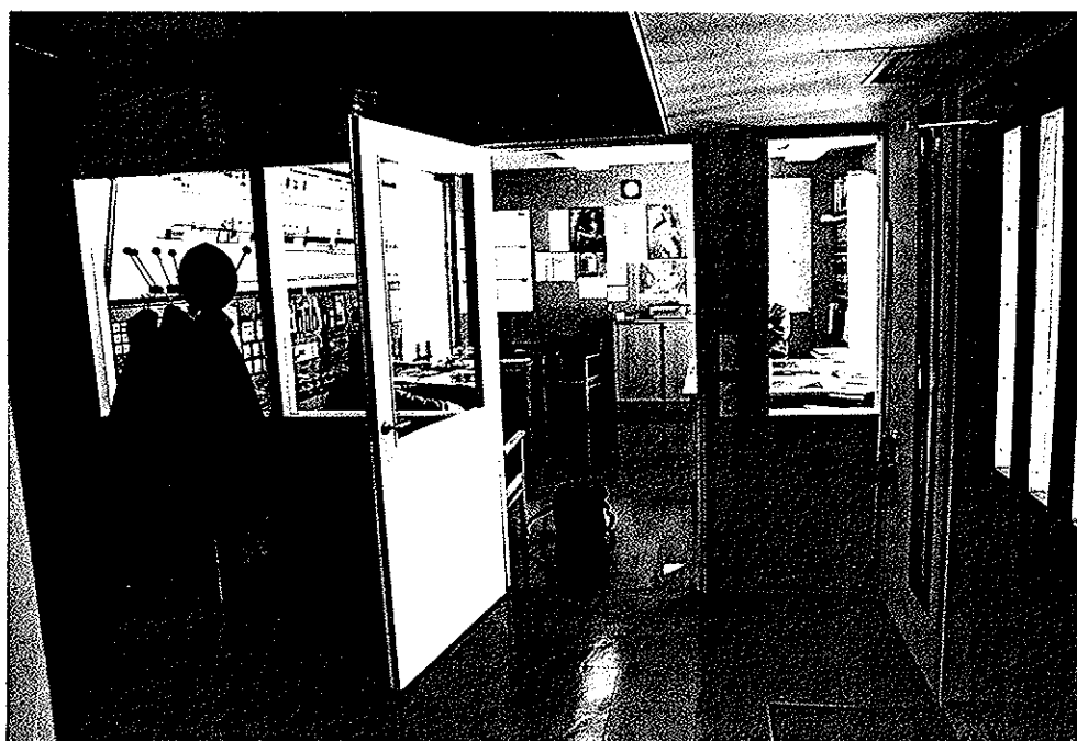
Kuva 4. Tapaturman uhri löydettiin paikasta, jossa kuvassa laukku.