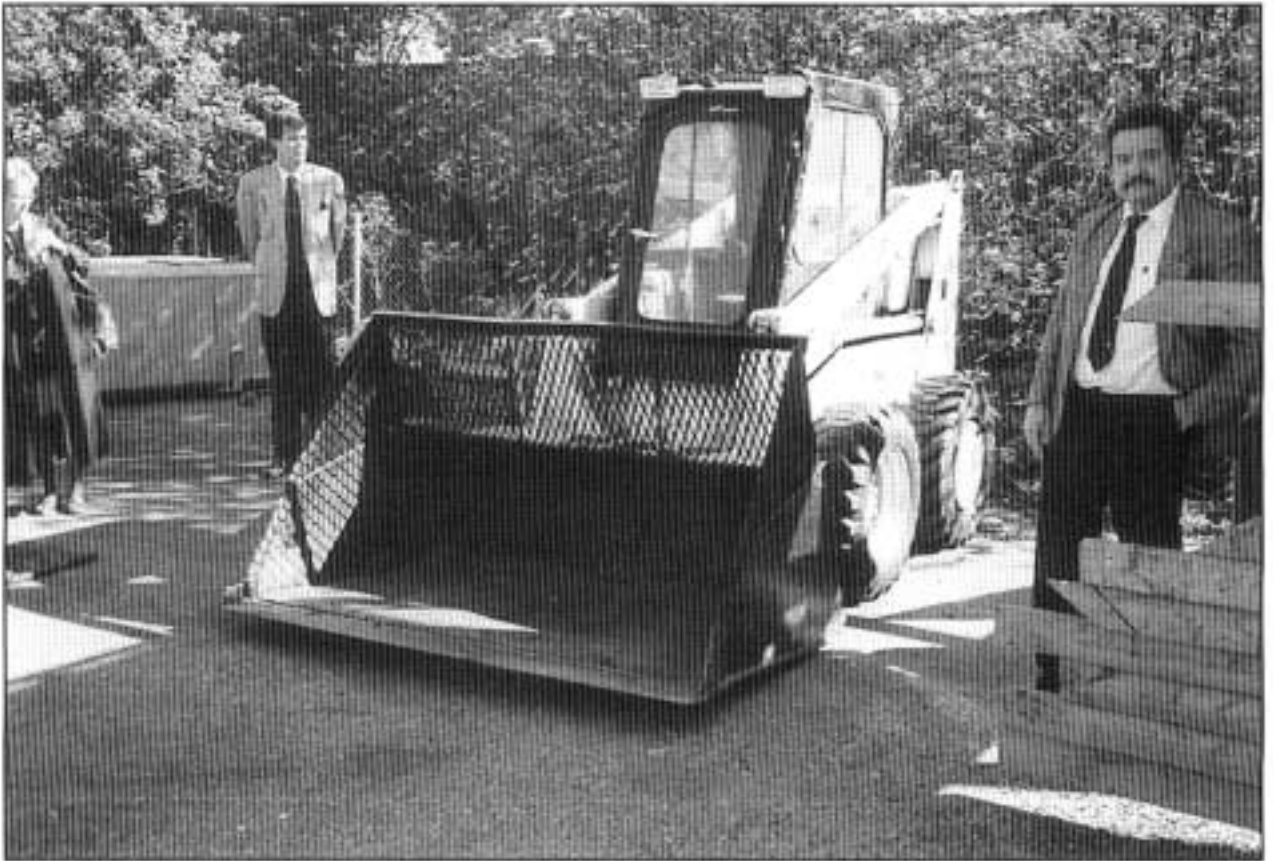
Kuva 1. Onnettomuskone.