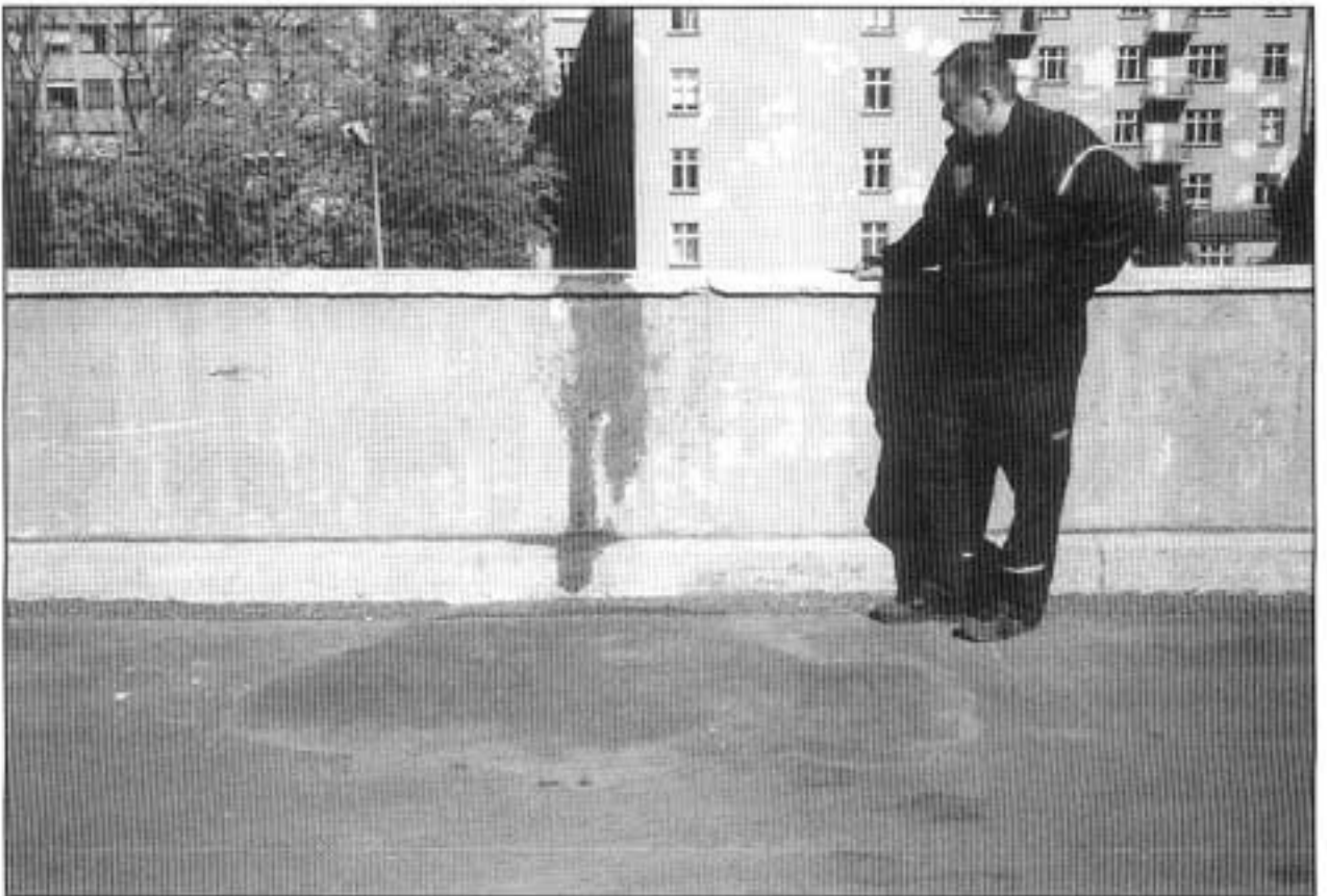
Kuva 2. Onnettomuuskohta. Kuvassa kauhakuormaajasta valunutta öljyä.