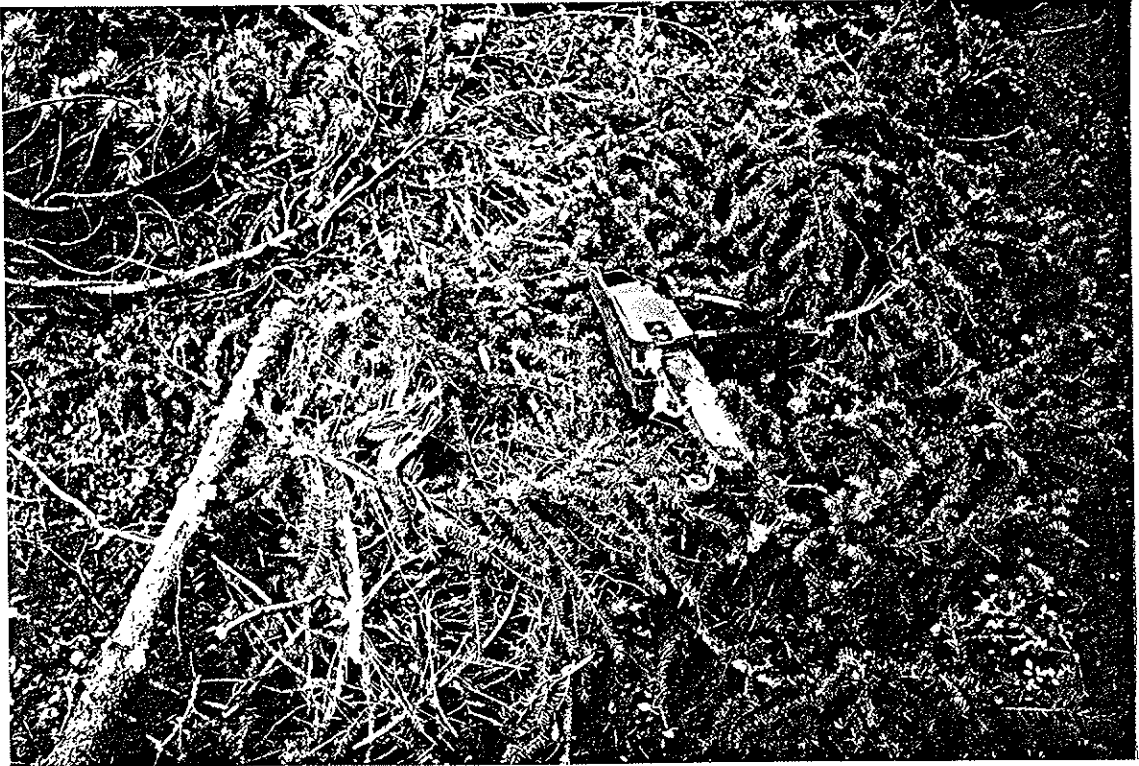
Moottorisaha ja katkaistu latva. Moottorisahan terässä nöyhtää.