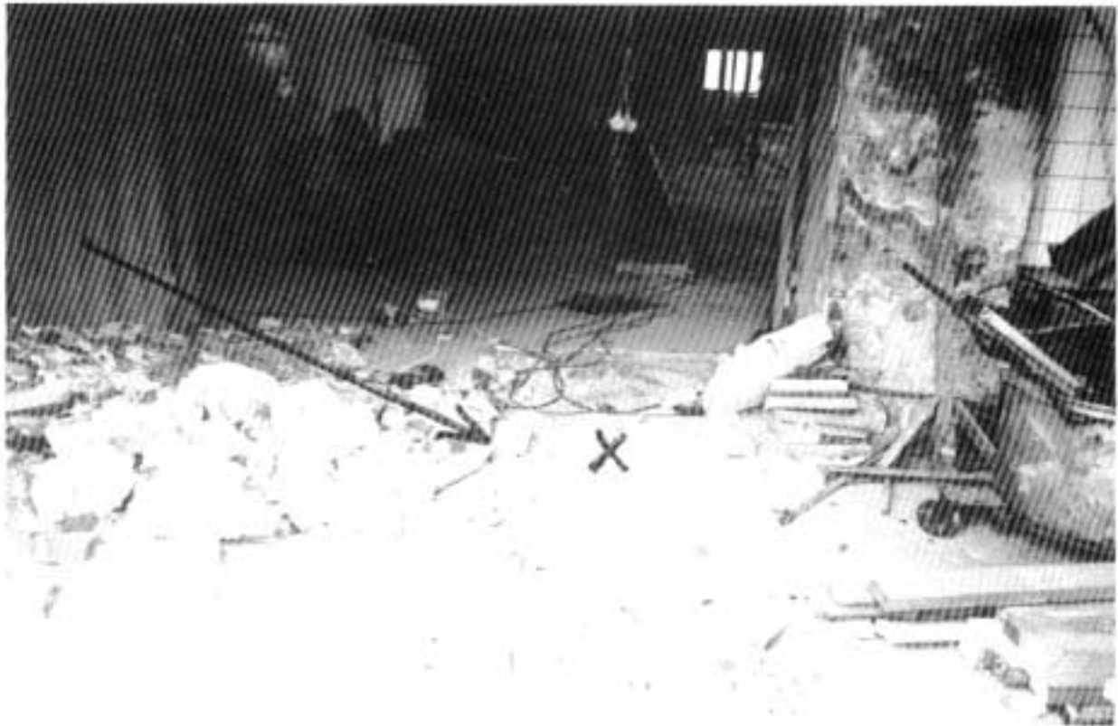
Kuva 3. X = N.N:n työskentelypaikka — = seinän kaatumissuunta.