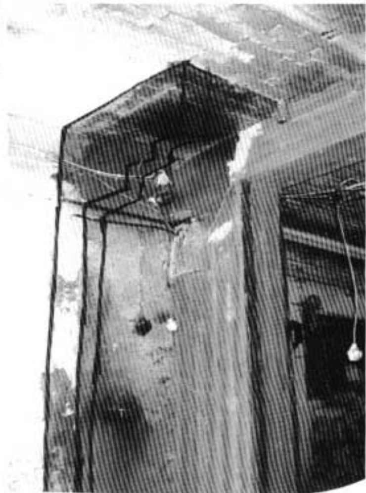
Kuva 2. Kuten kuva 1.

Kaatonut seinänpätkä hahmoteltu kuulustelun perusteella.