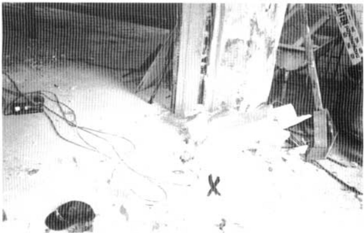
Kuva 4. X = N.N:n työskentelypaikka ja N.N:n päälle pudonnut lohkare.