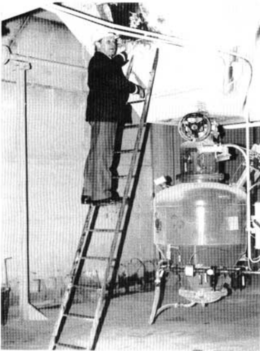
Kuva 1. Kohta, jossa NN seisoi tikkailla sairaskohtauksen tullessa.