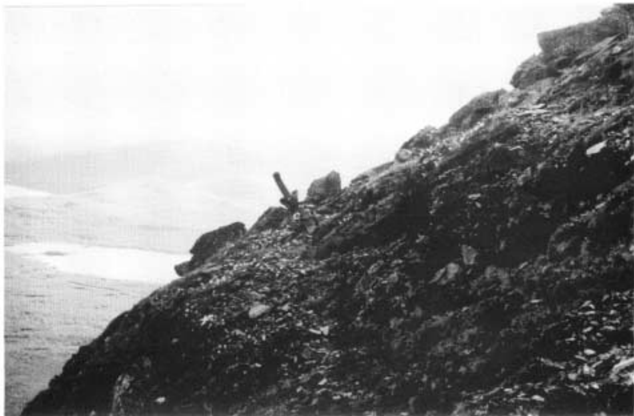
Kuva 2. N.N:n löytöpaikka