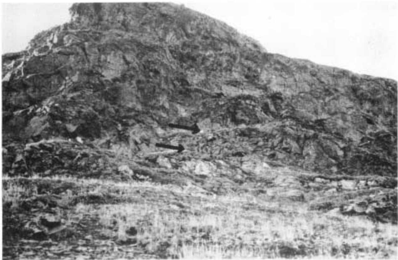
Kuva 1. Ylempi nuoli — poropolku, alempi — N.N:n löytöpaikka.