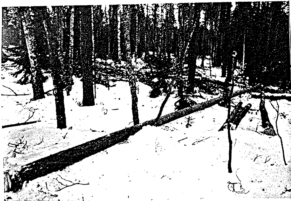
Kuva 2. Kaatunut mänty ja koivu, joka on ollut luokilla.