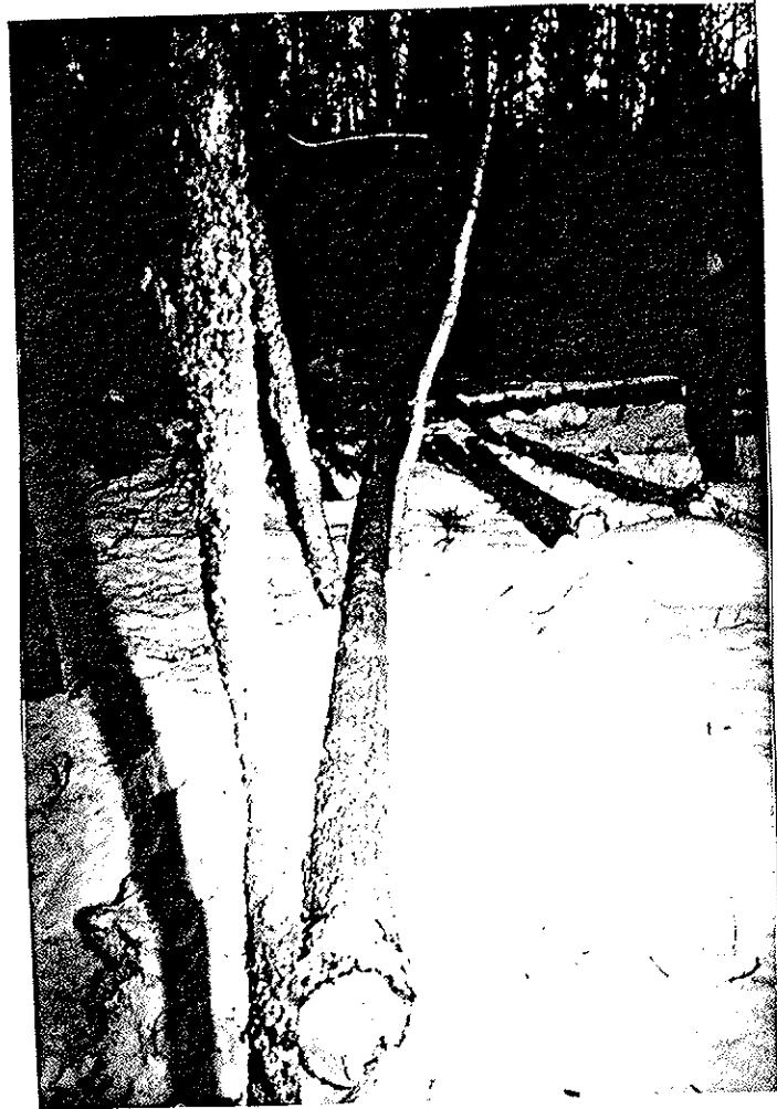
Kuva 1. Puu kuvattuna kannon suunnasta