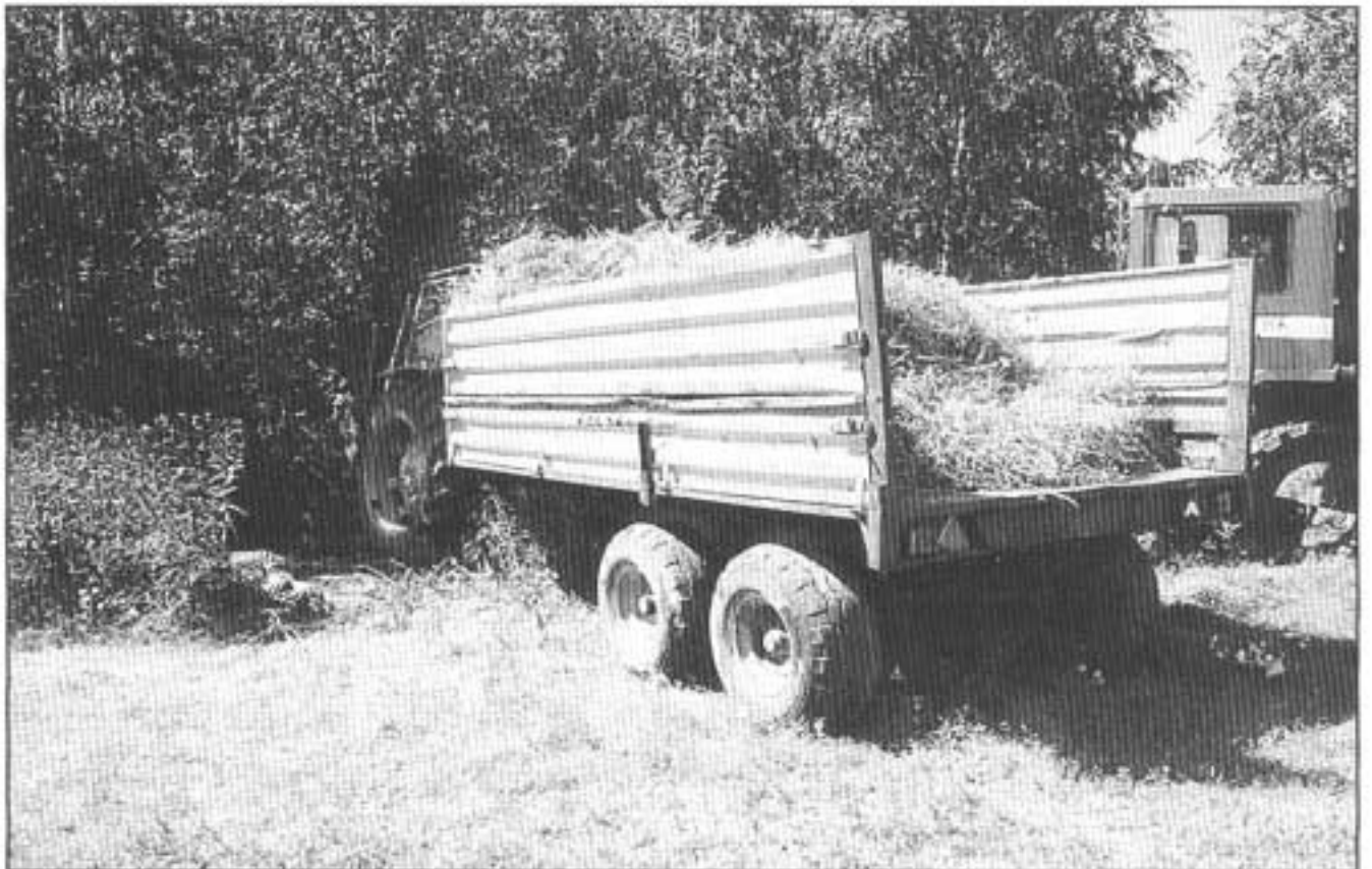
Kuva 2. Traktori osittain pusikossa.