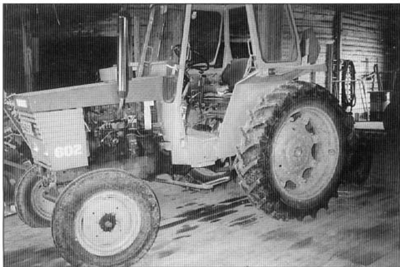
Kuva 3. Traktori, astinrauta.