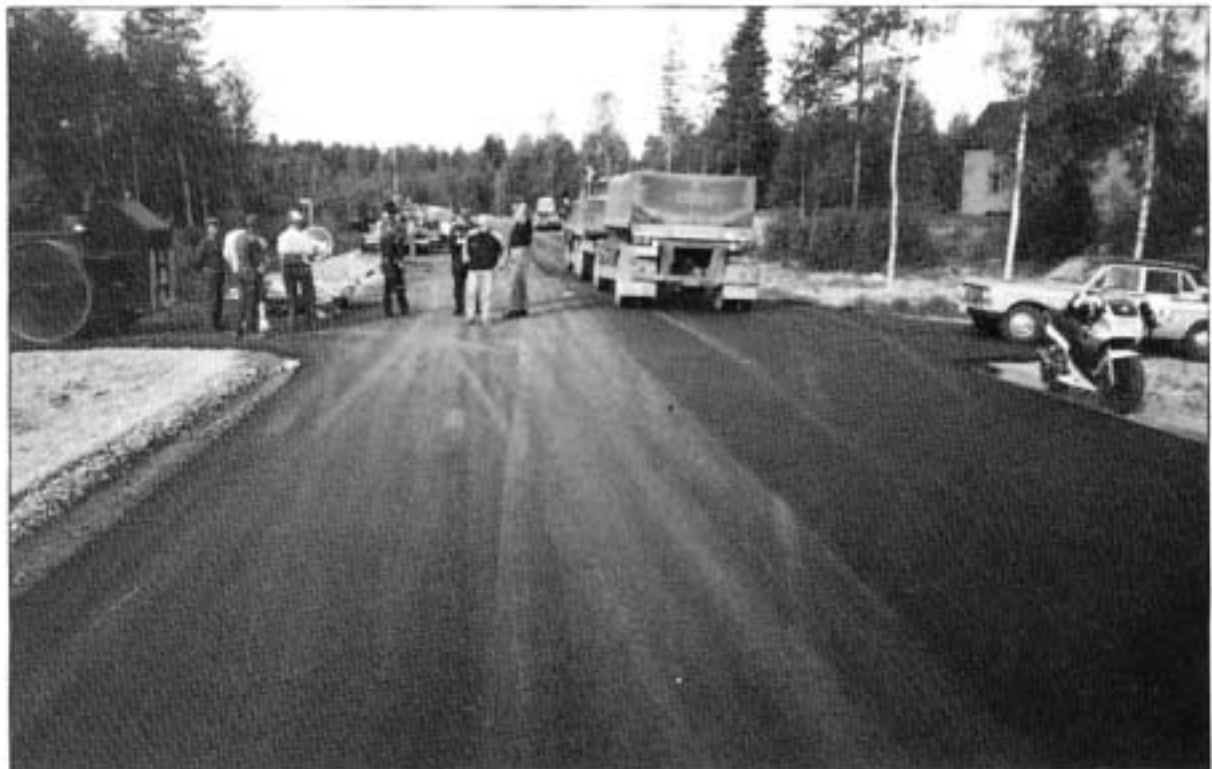
Kuva 2. Tapahtumapaikka kuvattuna T:n suunnasta tultaessa.