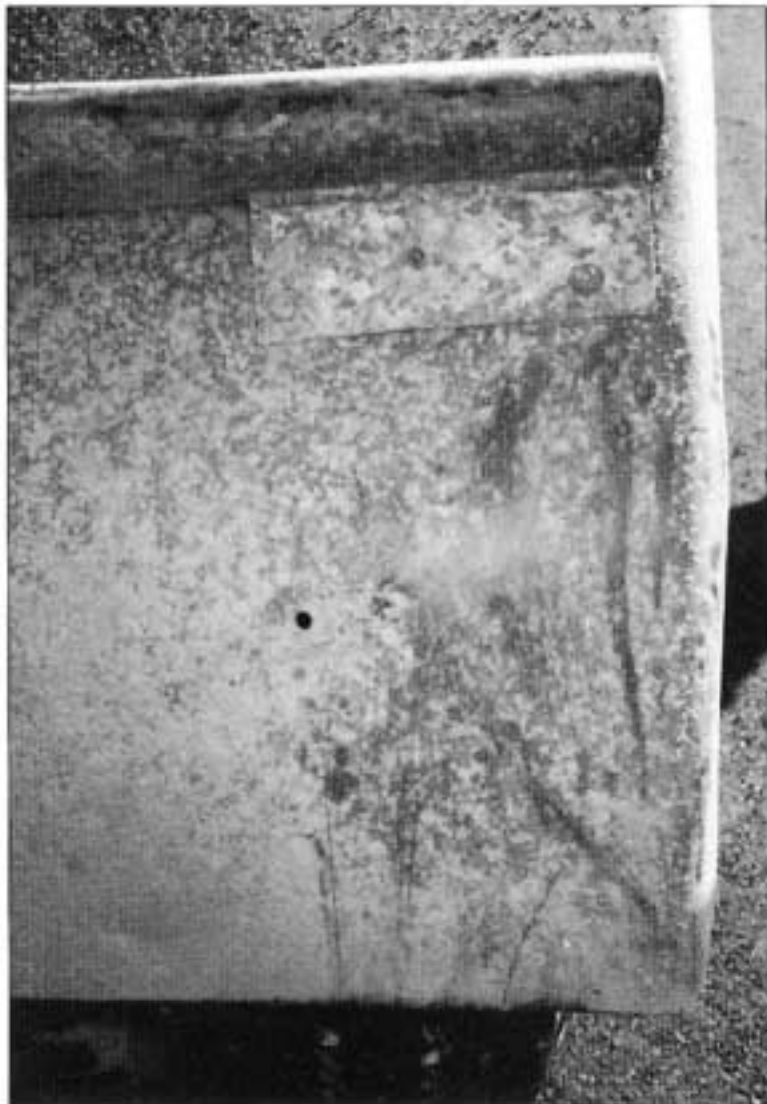
Kuva 4. Em. hankausjälki kuvattuna läheltä.