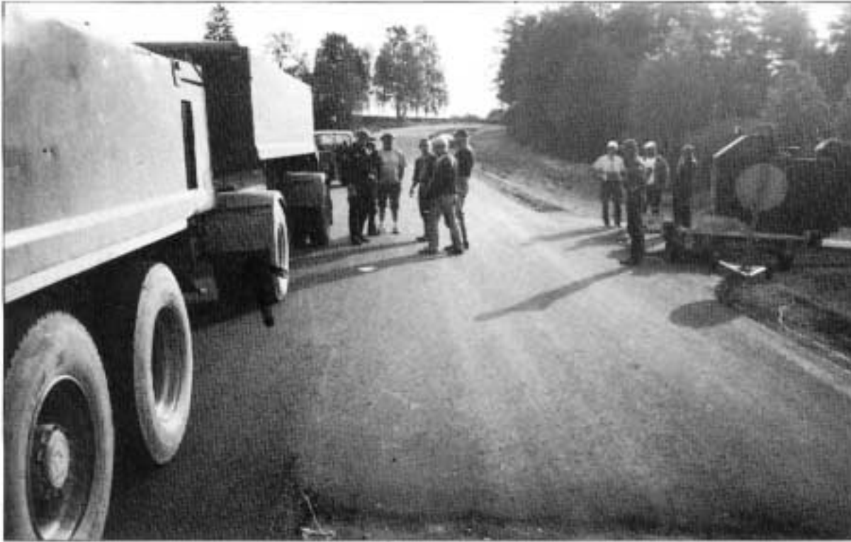
Kuva 3. Perävaunun vasemman etupyöräparin kurakaari, jonka etureunassa nuolen osoittamassa kohdassa tuore hankausjälki.