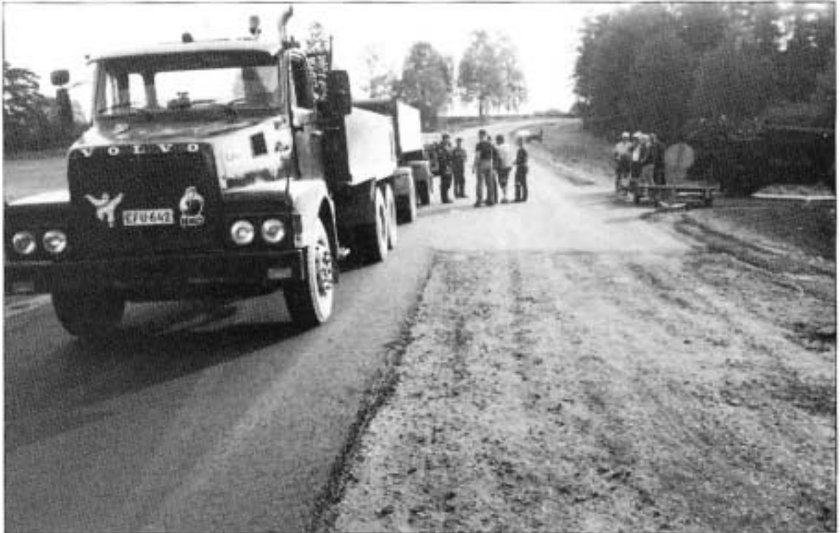
Kuva 1. Tapahtumapaikka kuvattuna valtatie 5:n suunnasta.