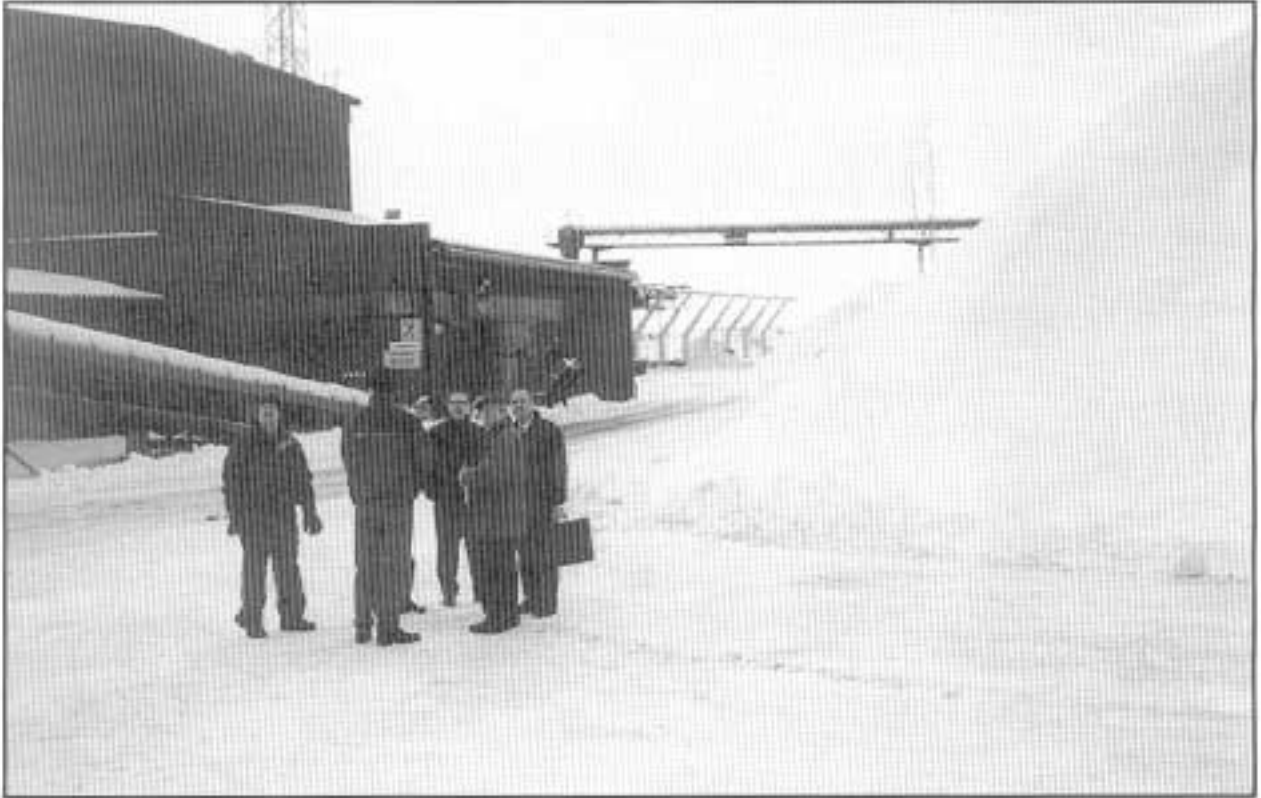
Kuva 1. Miesryhmä MN:n löytöpaikalla. Takana hakeasema, oikealla purukasa, joiden välissä olisi työkone ollut.