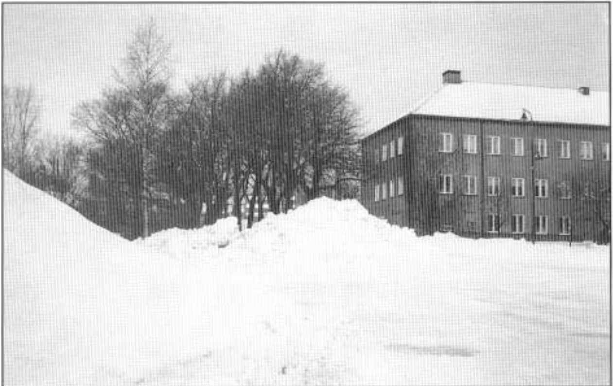
Kuva 2. NN tuli takana olevan konttorin vieritse, liukastui vasemmalla olevan purukasan kohdalla.