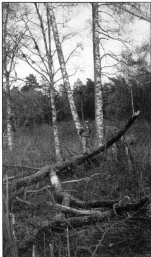
Kuvat 1 ja 2. Kaatunut konkelo ja kanto.