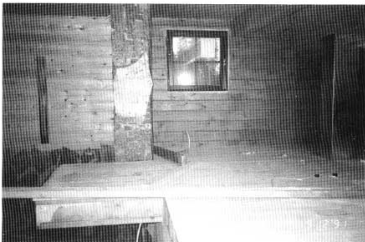
Kuva 1. Saunan parvi, jolta muurarit päällystivät savupiippua. (Kuva otettu 4 päivää tapahtuman jälkeen.)