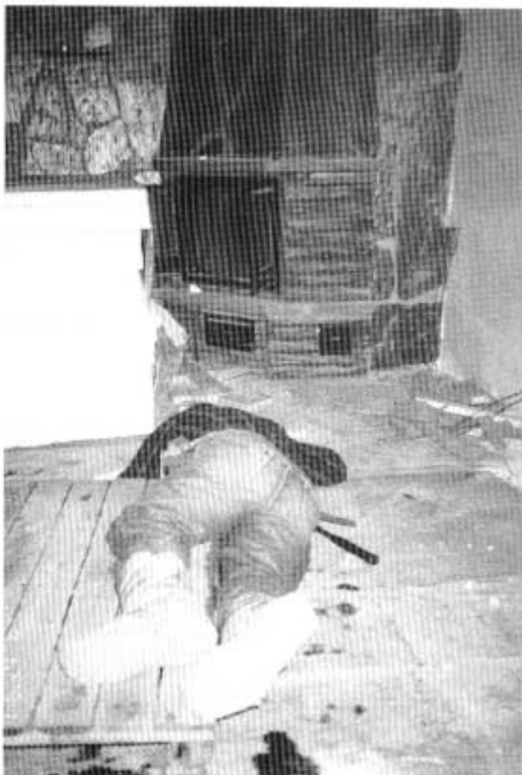
Kuva 2. Kuva kohdasta, mihin NN putosi. (Kuva on lavastettu).