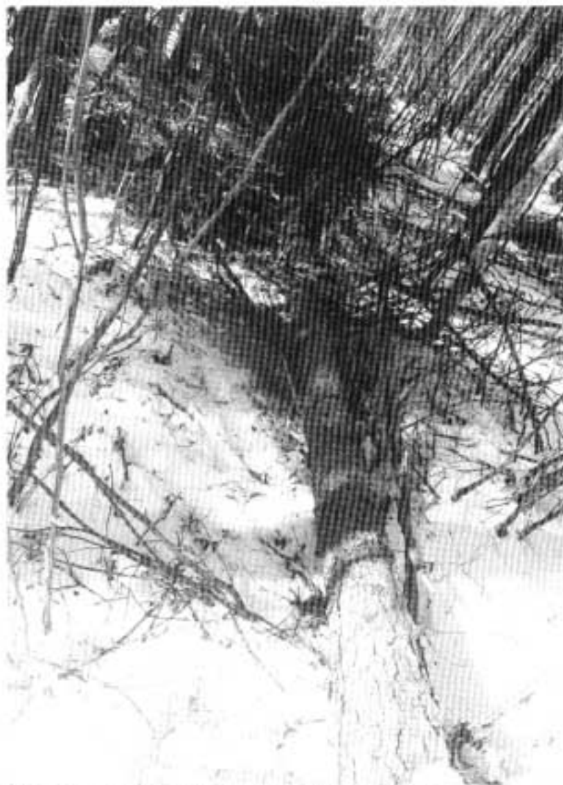
Kuva 1. Mänty, jota N.N oli karsimassa, kulkien rungon vasemmalla puolella.