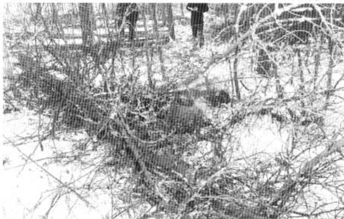
Kuva 2. Männyn ympärillä oli huomattavan paljon risuja ja näreikköä, mikä vaikeutti karsimista.