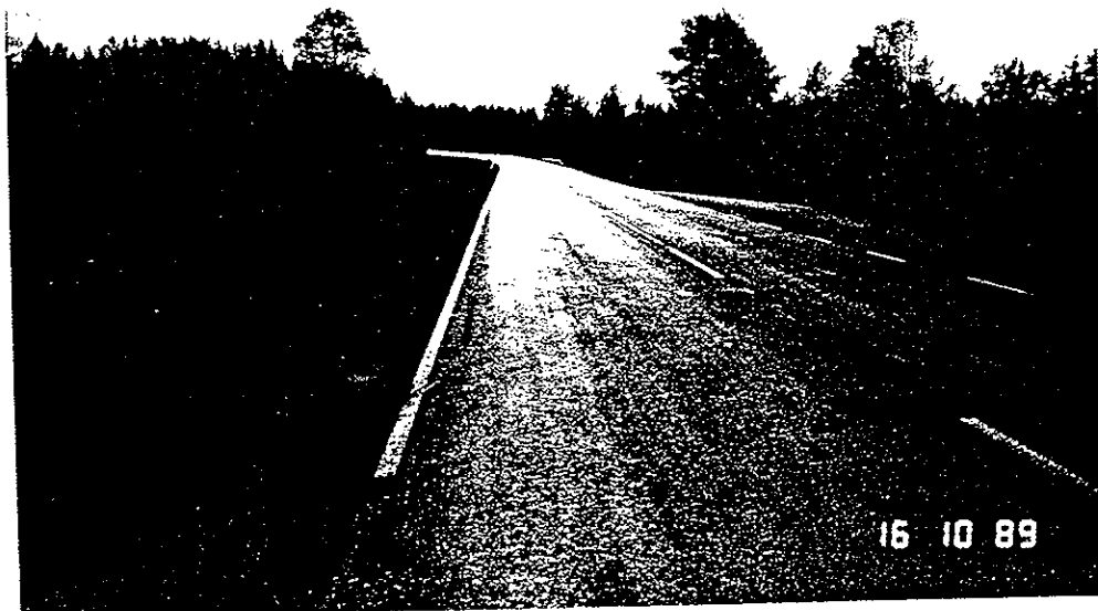
Kuva 1. Näkymä liikenteenohjaajan paikalta