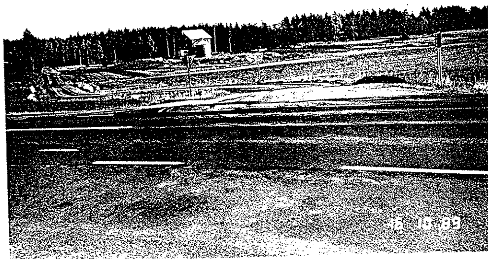
Kuva 2. Kuva onnettomuuspaikalta